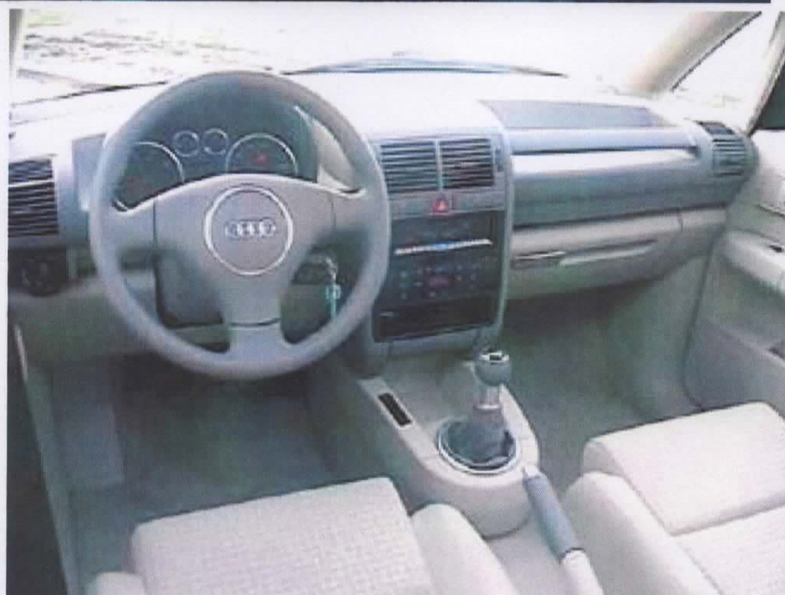
Open-Sky-System, Gehele dak is van GLAS