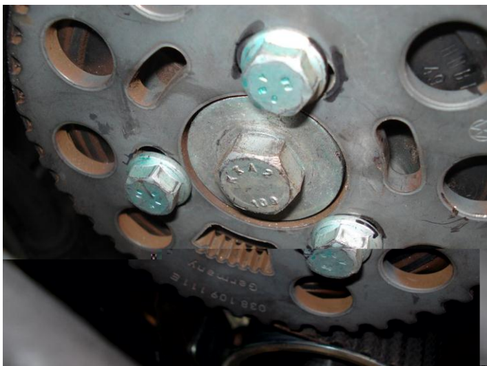
Markering op bouten om verschuiving te kunnen bepalen

4. markeer waar de 3 bouten zich momenteel bevinden ten opzichte van het tandwiel (bv met een permanent marker of met een fine-marker)