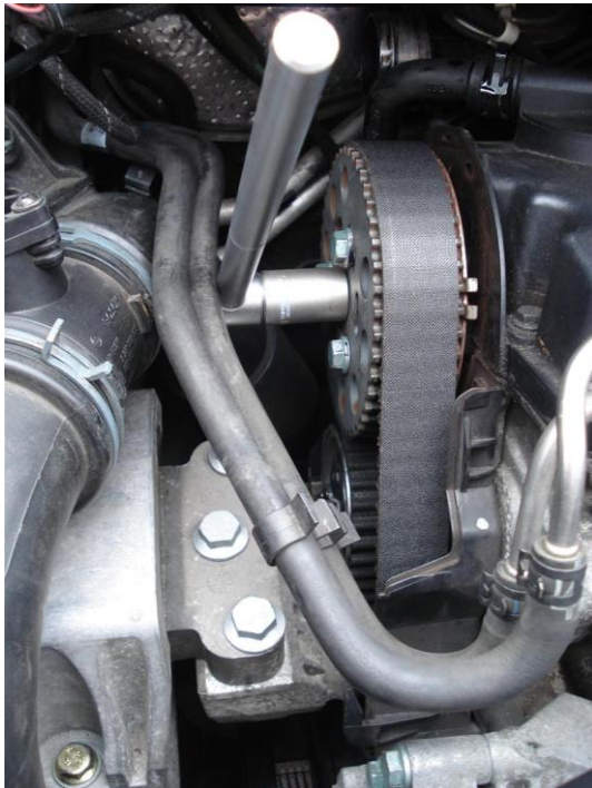
Centraalbout nokkenas verdraaien (minimaal!)

6. heb je een negatieve waarde in veld 4 van groep 4, draai dan de centraalbout van de nokkenas tegen de klok in (mbv sleutel of dop 18). Let op: verschuif niet meer dan een millimeter en draai vervolgens de 3 bouten weer vast (aantrekmoment is 25 nm).